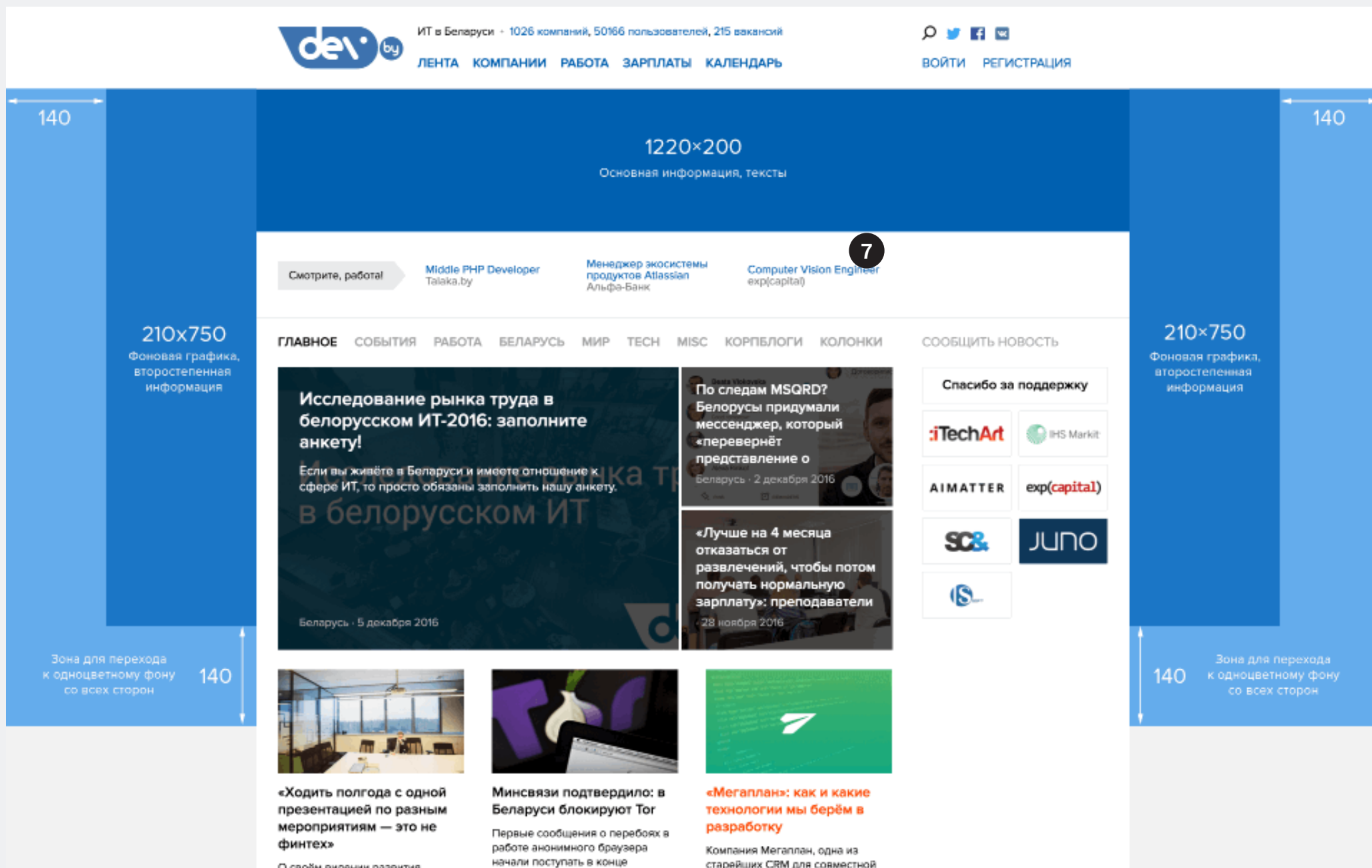
Схема брендирования главной страницы